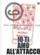
Progetto-9 313 Alan Zeni Un progetto di condivisione di Sodni