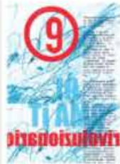
P-9 413. Alan Zeni