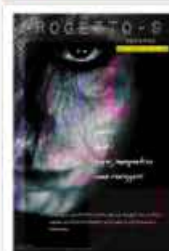
Progetto-9 Maggio numero zero