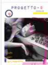
P-9 Giugno Alan Zeni Magazine about Art, Music, Colour, and U!