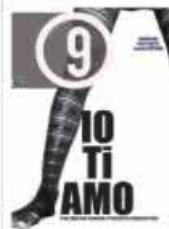
Progetto-9 113 Alan Zeni Magazine Cool che dà spazio ai sogni di arte, cultura musica, viaggi ed