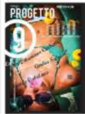
P-9 giugno 2012 Alan Zeni