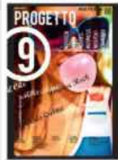
P-9 Maggio 2012 Alan Zeni Art Creative Magazine about