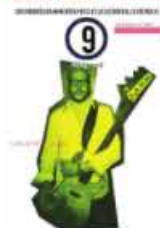
p-9 settembre Alan Zeni number tour of this creative magazine for music