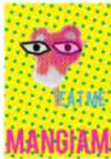
P9 Giugno 2013 Alan Zeni