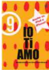
P-9 Luglio / Agosto Alan Zeni Hi What You