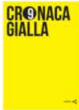
P9 11|13 Alan Zeni Cronaca Gialla Yellow. Power Your life in a simple