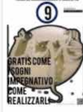
P9 novembre Alan Zeni il magazine dei giovani creativi e dei loro sodni