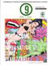
P-9 Dicembre Alan Zeni Magazine creativo per realizzare i nostru sogni