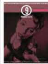
p-9 ottobre Alan Zeni